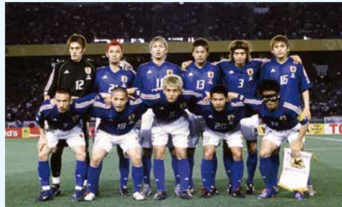
2002FIFAワールドカップ「日本vsロシア」

午年生まれの性格 行動力と実行力 ：筋肉質な馬のように、自分の意思で行動します。 社交的で人気者 ：明るく前向きな性格で、人から好かれやすいです。 責任感と独立心が強い ：人に頼ることを嫌い、自分で物事を成し遂げようとします。 話上手で聞き上手 ：おしゃべりだけでなく、人の話を聞くのも得意です。 新しいことへの挑戦 ：冒険心があり、新しいことに積極的に取り組みます。