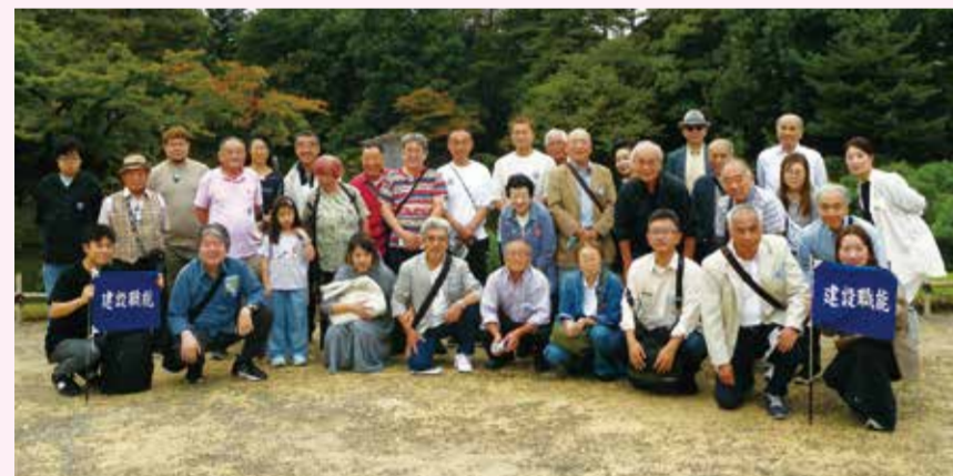
見学地「兼六園」(金沢市)にて

連合会法人化55周年記念『北陸新幹線で行く金沢ツアー』を2025年10月8日(水)～9日(木)に開催しました。多数の会員の皆様にご参加いただき、有意義な記念旅行となりました。