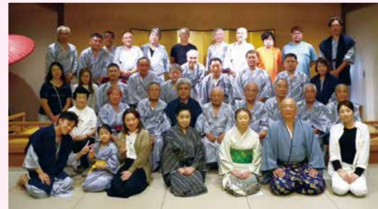
宿泊地「ゆのくに天祥」(加賀市)にて